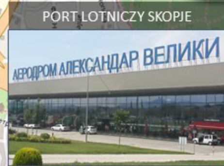
PORT LOTNICZY SKOPJE