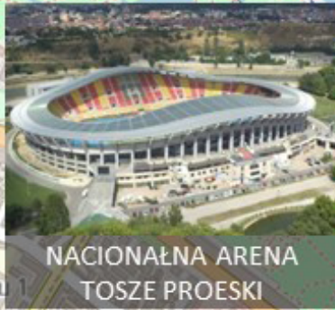
NACIONALNA ARENA TOSZE PROESKI